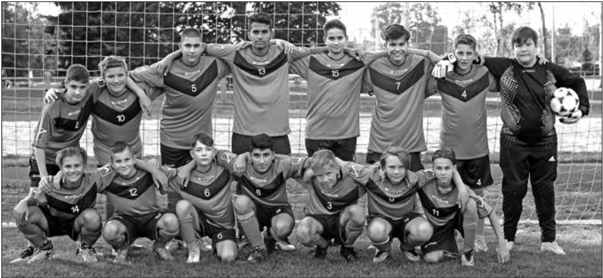
Mannschaftsbild beim Pokalspiel

Das erste Pflichtspiel war die erste Runde im BFV-Baupokal: Zuhause empfingen wir den SC Worzeldorf - dass dieser eine Liga höher spielt, konnte man gleich von Anfang sehen. Wir hatten nicht viele Chancen und verloren mit 0:7 gegen den SC Worzeldorf.